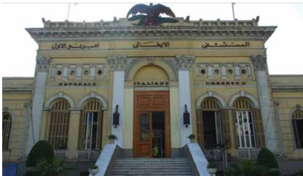
Entrata e facciata monumentale dell'Ospedale italiano

L'Ospedale Italiano al Cairo, è un Ente non-governativo, senza fini di profitto. Offre assistenza medica ed ospedaliera a tutti, con o senza compenso, senza differenza tra etnie e religioni, come servizio umanitario e non per lucro.