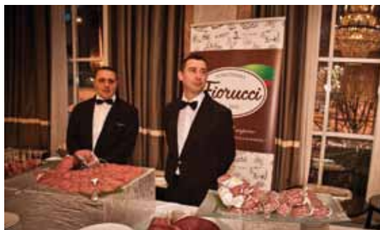
▲ Postazione Fiorucci