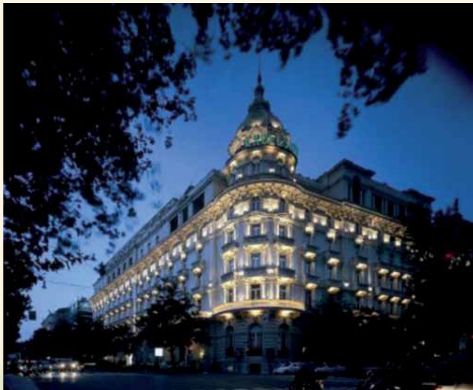
Hotel Excelsior, Via Veneto 125 - Roma